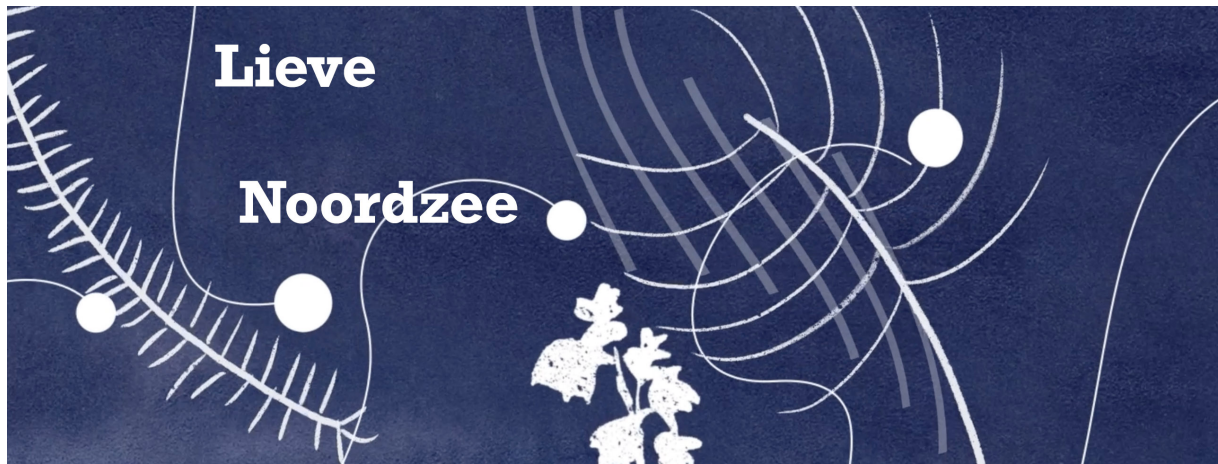
Animatie 'Solliciteren bij de Noordzee' in opdracht van Stichting Living landscapes. © Marike Knaapen